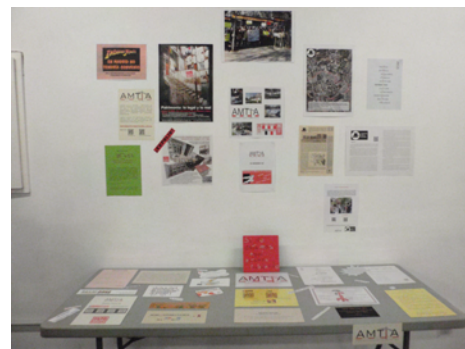
Espacio de AMTTA en Meet Arch

La asistencia y la presencia en redes han sido valorados en un interesante análisis por lo compañeros de JANSÁ _ App Cultura (asistencia media de 500 personas con un pico máximo de 1248 por la tarde, las publicaciones sólo en Facebook, tuvieron un alcance orgánico en la semana completa, de alrededor de las 20.356 personas).