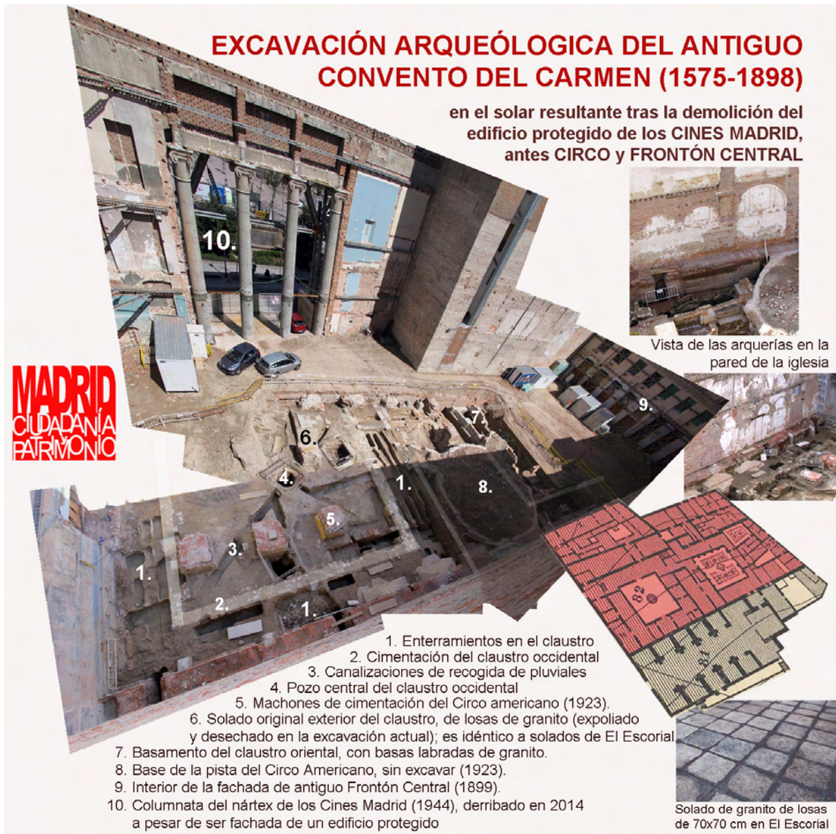
Imagen comentada de la excavación, publicada en la web www.mcyp.es . Autor: Álvaro Bonet