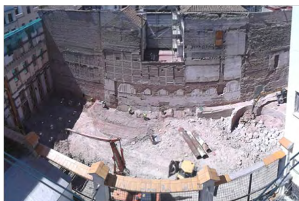
Imagen que muestra la demolición de los restos aparecidos.

En la excavación han aparecido las trazas de la planta del convento, así como la presencia de la pista del circo que se instaló en 1924. Los restos, por estar a cota inferior que la rasante moderna, van más allá de meras cimentaciones, habiendo aparecido el basamento de los claustros, con basas talladas en granito y solados originales, interiores y exteriores, así como el pozo y conducciones de pluviales, además de enterramientos con lápidas e inscripciones.