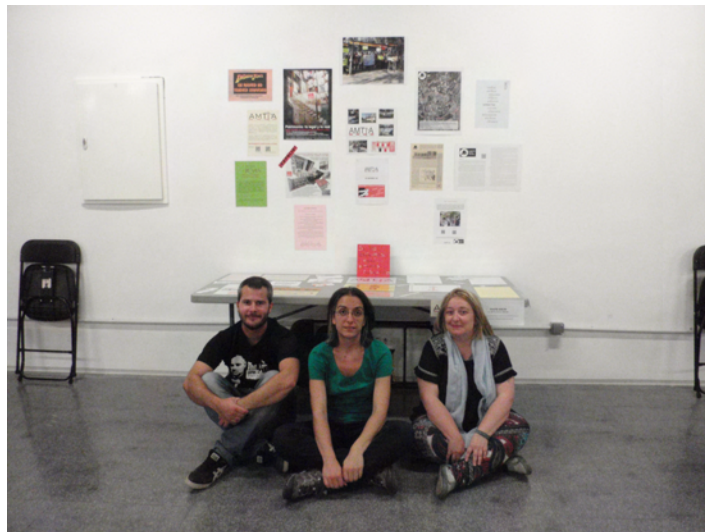
Actual Junta Directiva de AMTTA.