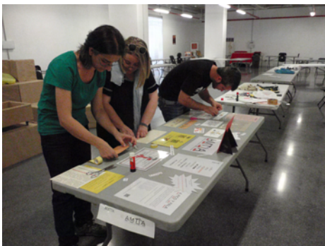
Espacio de AMTTA en construcción

AMTTA participó en este encuentro con un espacio en el que se expusieron las iniciativas, motivaciones y actividades que realiza la asociación. Nuestra idea era haber proyectado el vídeo: "AMTTA hace COMUNIDAD. Patrimonio en Alerta Roja." No pudo verse completo y por desgracia nos falló la técnica pero habrá más ocasiones. En 2012, la Asociación Madrileña de Trabajadores y Trabajadoras en Arqueología (AMTTA) se integró en Madrid Ciudadanía y Patrimonio (MCyP). Esto ha supuesto un viraje profundo en nuestra metodología de trabajo. Nos hemos vuelto más poderosos e insumisos. También más ambiciosos. Nuestras batallas ya nunca son solitarias, resultan más transversales, muy sociales, profundamente comunitarias y públicas. Este vídeo realizado por Jesús Rodríguez, hacía un repaso de algunas de esas heridas abiertas del Patrimonio madrileño.