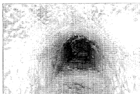
Bodegas subterráneas. Interior

vienda principal, el molino de papel y sobre todo la ermita del conjunto, bajo la advocación de la Soledad.