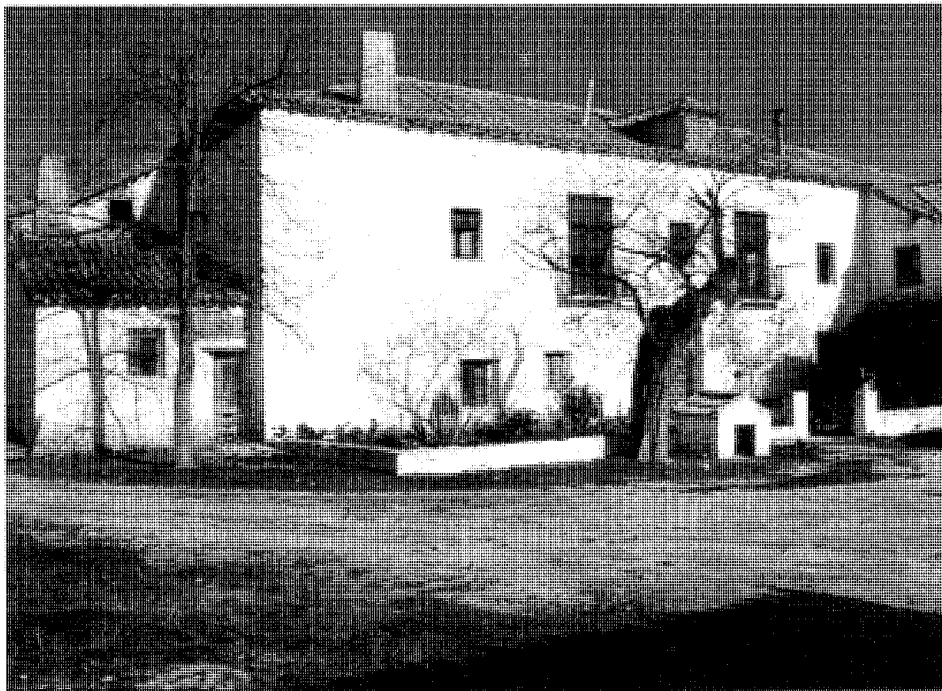
Vivienda. Fachada principal

Grado 1º Integral (Normas Subsidiarias de Planeamiento. 1987).