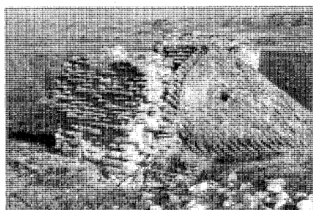
Bodegas subterráneas. Vista posterior